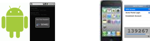
ソフトウェアトークン（無償）

低価格の認証サーバとトークンの組み合わせにより、導入コストと運用コストを削減することができます。また、 スマートフォン向けのソフトウェアトークンは無償 ですので、スマートフォンをトークンとして利用することにより、さらにコストを抑えることができます。