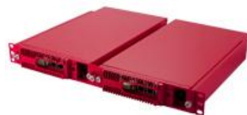
AuthWay アプライアンス版

アプライアンス提供 の「AuthWay」と ソフトウェア提供 の「AuthWay Software」の2種類がありますので、利用環境に応じあて選択することができます。アプライアンスは冗長構成（2台構成）でも1Uのラックに格納できるため、省スペース低消費電力を実現します。