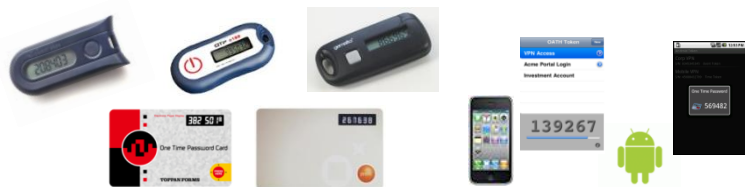
ハードウェアトークン